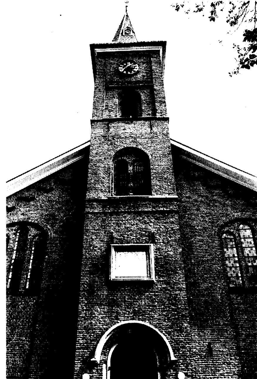
De Noorderkerk in Spakenburg

Wat blijft er nog meer over als het drukken bij geloofsgenoten in Duitsland wordt uitbesteed? De heer Crans deelt mee, dat het aantal Jehovah's Getuigen in Nederland 32.000 bedraagt, verdeeld over 375 gemeenten. Daarnaast zijn er zo'n 20.000 belangstellenden. „Al